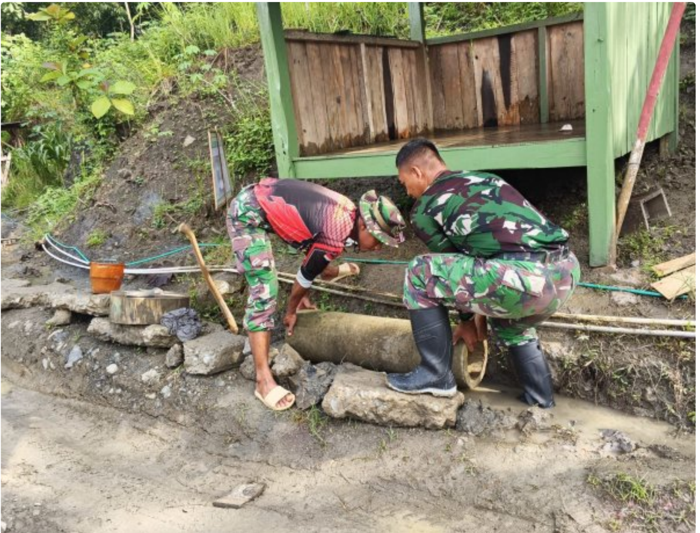
Foto: Personel TNI bersama warga melaksanakan pembangunan gorong-gorong di depan poskamling memastikan aliran air tetap lancar, bertempat Desa Somagede, Kecamatan Sempor, Kabupaten Kebumen, Jawa Tengah. Pada Jumat (20/2/2026).

KEBUMEN - Pembangunan infrastruktur dasar terus digenjut Satgas TMMMD