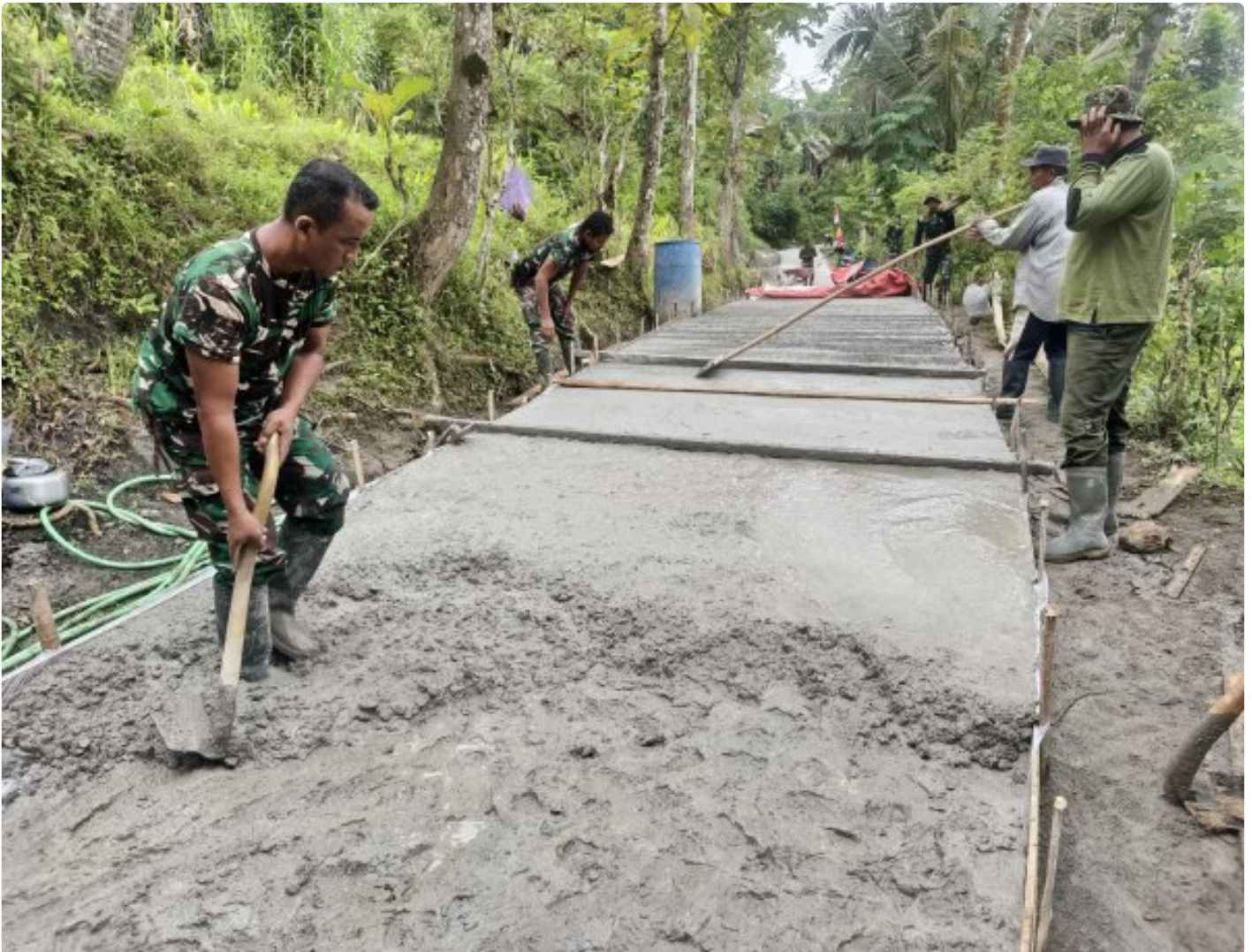
Foto: Pemandangan situasi lokasi meski langit Kebumen menitikkan rintik gerimis, semangat juang Satgas TNI Manunggal Membangun Desa (TMMD) Reguler ke-127 Kodim 0709/Kebumen dan warga Desa Somagede tak sedikit pun surut. Pada Kamis (19/2/2026).

KEBUMEN - Meski langit Kebumen menitikkan rintik gerimis, semangat juang Satgas TNI Manunggal Membangun Desa (TMMD) Reguler ke-127 Kodim 0709/Kebumen dan warga Desa Somagede tak sedikit pun surut. Pada Kamis