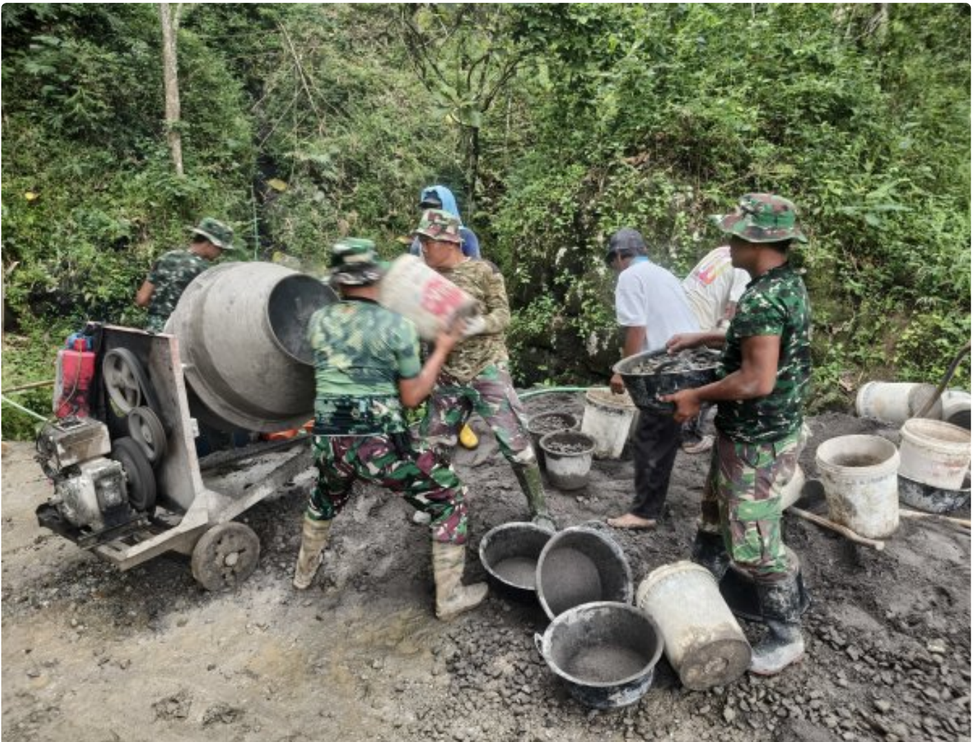
Foto: Anggota Satgas TMMD Reguler ke-127 dari Kodim 0709/Kebumen bersama warga Desa Somagede tak kenal lelah, dengan ketelitian luar biasa, meracik setiap takaran semen, pasir, dan koral dalam pembangunan jalan rabat beton, Kamis (19/2/2026).

KEBUMEN - Di tengah hijaunya perbukitan Desa Somagede, Kecamatan