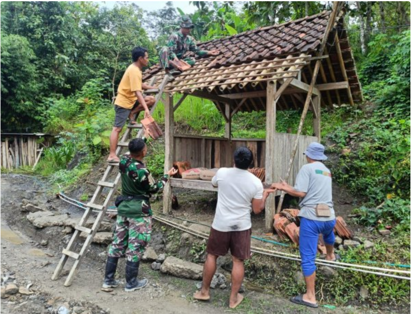
Foto: Saat Satgas TMMD Reguler ke-127 dari Kodim 0709/Kebumen melaksanakan pembersihan atap genteng dan pengecatan Pos Keamanan Lingkungan (Poskamling) di Desa Somagede, Kecamatan Sempor, Kabupaten Kebumen, Jawa Tengah, Sabtu (14/2/2026).

KEBUMEN - Semangat pengabdian prajurit TNI kembali menyatu dengan denyut