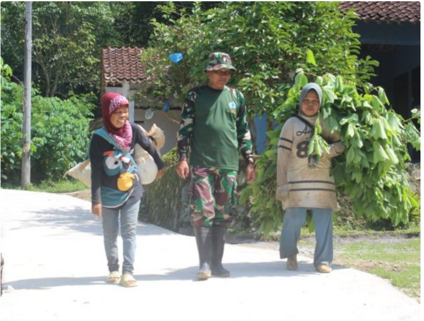
Foto: Anggota Satgas TMMD tak ragu menyisihkan waktu untuk menyapa sekumpulan ibu-ibu yang sedang memanggul rumput di pundak mereka di Desa Somagede, Kecamatan Sempor, Kabupaten Kebumen, Jum'at (20/2/2026).

KEBUMEN - Di tengah hiruk pikuk pembangunan fisik program TMMD Reguler ke-